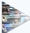
Смотрите видео с нашими экспертами

У нас действуют акции по предварительной регистрации на мероприятия!